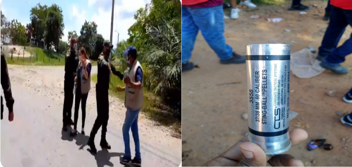
Fotografía del 23 de julio de 2021. Agresión de policías a defensores de derechos humanos de CREDHOS y munición del ESMAD abandonada en el sector donde se encuentran los manifestantes.

acompañamiento a la población con el fin de observar que no hubiese una violación a derechos fundamentales de las y los manifestantes.