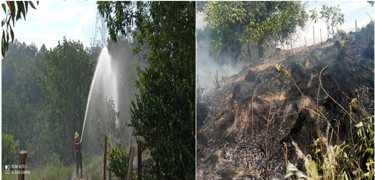
Fotografías del 23 de julio de 2021. Incendio forestal generado por la acción del ESMAD y Policía Nacional en el sector donde se encuentran los manifestantes. Bomberos de Barrancabermeja detienen la propagación del incendio.

NOTA: En archivo conservamos material de video sobre las agresiones a defensores de derechos humanos y periodista de CREDHOS de fecha 23 de julio de 2021.