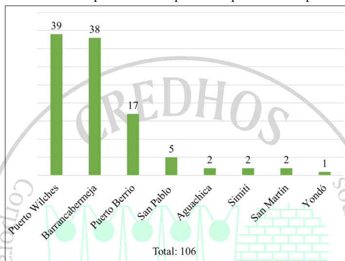
Figura No. 3. Acciones contra la población civil por municipio durante el primer trimestre de 2022.

En la Figura No. 3, se evidencia el número de acciones contra la población civil en cada municipio, donde en Puerto Wilches, Barrancabermeja y Puerto Berrio se concentra el 88,7% de los hechos registrados.